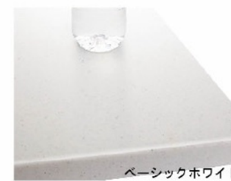
人造大理石トップ

インテリアに合わせてカラーコーディネート。耐久性にも優れた人造大理石トップです。