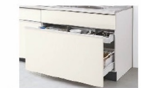
メラミン底板 ダンパー付ローラーレール