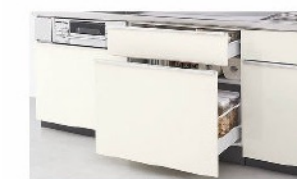
メラミン底板 ダンパー付ローラーレール