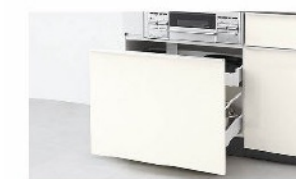
メラミン底板 ダンパー付ローラーレール